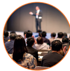
Palestras e Treinamentos