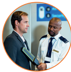
Portaria e Segurança